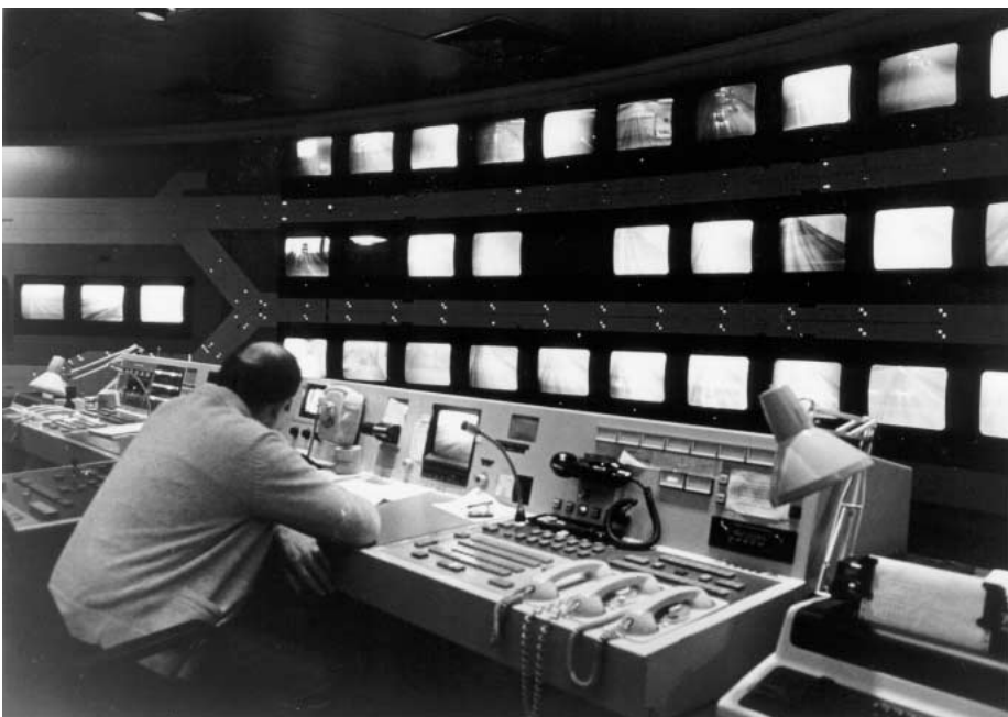
Überwachungsraum einer Leitstelle: Solche Bilder kennen wir alle aus Film und Fernsehen. Der Mensch von heute wird beinahe auf Schritt und Tritt beobachtet.