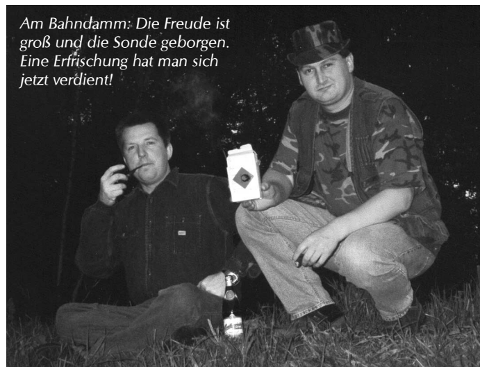
Am Bahndamm: Die Freude ist groß und die Sonde geborgen. Eine Erfrischung hat man sich jetzt verdient!

Erfahrungsgemäß kann dann beim Maßstab der kleinen Karte (1:25.000) der Landesektor so groß wie eine 1-Mark-Münze sein. Das entspricht in etwa einem Radius von 200 Me-tern um den Koordinatenschnittpunkt! Mehr wäre bei den einfachen Mitteln und aus